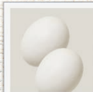
Eierschale natürliche Calciumquelle