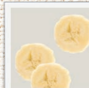
Banane Kalium sowie Vitamin A, C & E