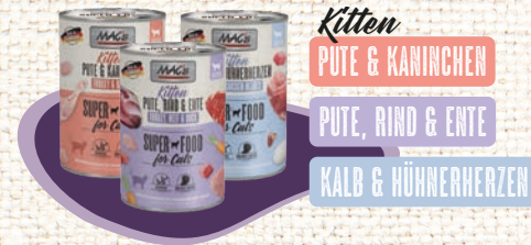
Kitten PUTER & KANINCHEN