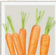
Karotte Vitamin A & Beta-Carotin