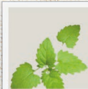
Katzenminze kann appetitanregend & beruhigend sein