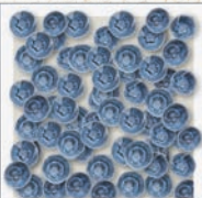
Blaubeere Vitamin C & E