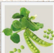
Erbse pflanzlicher Proteinlieferant