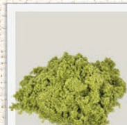
Seealgenmehl natürlicher Jod-Lieferant