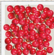
Cranberry Vitamin C & Antioxidantien