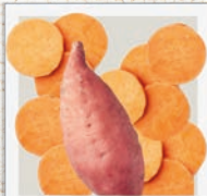
Süßkartoffel Ballaststoffe & Antioxidantien